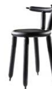
Carbon Balloon Chair 2013

In zijn ontwerpen combineert Wanders ambachtelijke techniek met een sterk gevoel voor verwondering en romantiek. Zijn Balloon chair is hiervan een treffend voorbeeld. Wanders kan 's werelds meest vooraanstaande merken tot zijn clientèle rekenen zoals Louis Vuitton, Alessi en diverse hotelketens. Zijn werk is opgenomen in museumcollecties waaronder die van het Centraal Museum, Centre Pompidou, Cooper-Hewitt National Design Museum, MoMA en Stedelijk Museum.