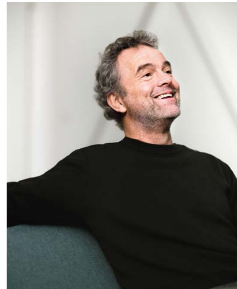
PIET HEIN EEK

Piet Hein Eek (1967) studeerde in 1990 af aan de Design Academy Eindhoven met zijn inmiddels klassiek geworden sloophouten kast. Hij opende in 1992 zijn eigen fabriek in Geldrop.