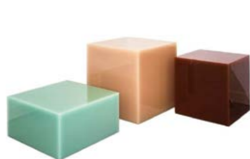
Peach Candy Cube 2016

Marcelis werkt in opdracht van verschillende commerciële klanten en modehuizen zoals Céline, Aesop, Burberry en Fendi. Museum Boijmans Van Beuningen heeft haar werk Dawn light in de collectie. Het Centraal Museum kocht recent haar werk SE 69 Soap Edition aan.