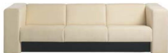
430 Kubusbank 1969

In 1991 kocht hij Het Arsenaal dat hij met zijn partner Monique des Bouvrie ontwikkelde tot een van Nederlands meest vooraanstaande design studio's.