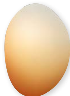
Off Round Hue Sunrise 2019