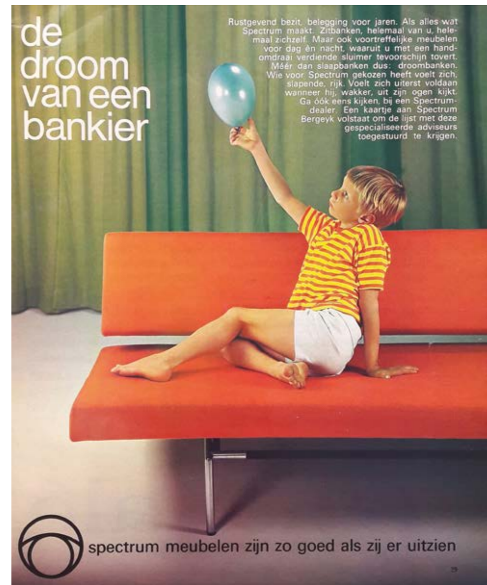
Brochure 't Spectrum, 1960 Advertentie, Avenue november 1967