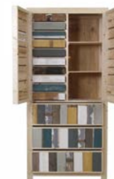
Sloophouten kast ontwerp 1991, uitvoering 2001

Hij won talloze prijzen en zijn ontwerpen zijn opgenomen in verschillende museumcollecties, waaronder die van het Centraal Museum.