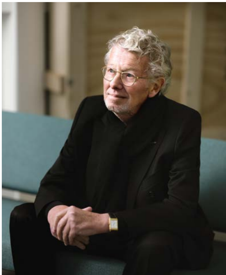
JAN DES BOUVRIE

Jan des Bouvrie (1942) maakte het moderne, met name witte interieur bereikbaar voor een groot publiek. Hij volgde de Kunstnijverheidsschool in Amsterdam (de latere Gerrit Rietveld Academie) en begon zijn carrière in de meubelwinkel van zijn ouders in Bussum.