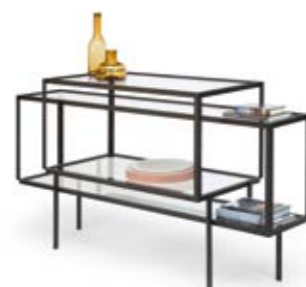
Tangled kabinet 2015