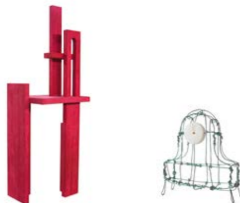
Space Poetry 2019 Floating Frames Mantelclock 2011

Kiki's werk is grillig en kleurrijk, lyrisch en persoonlijk, en tegelijkertijd verfijnd door bekwaam vakmanschap. Ze richt zich op verschillende productgroepen zoals tapijten, lampen, meubels, glaswerk en sculpturale accessoires zoals de Floating Frame klokken. Haar werk wordt wereldwijd gepresenteerd in musea, galleries, en op vliegvelden. Ze werkt samen met merken als Hermès, MOOOI en Häagen-Dazs.